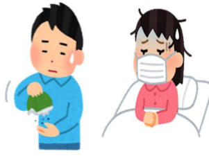
病院へ行きたくても行けない