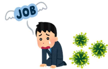
持病の影響で職を失い通院も困難