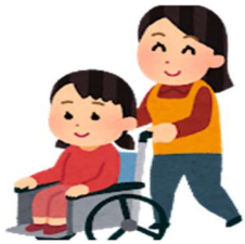
頻回な通院が必要